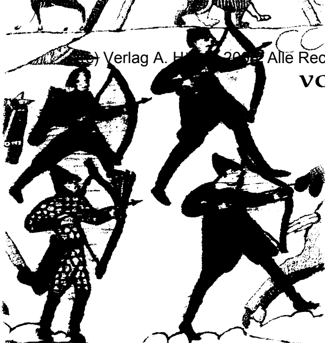
Angreifende Normannen (Teppich von Bayeux)

Der Sieg Wilhelms „des Eroberers“ über Harold II. unterwarf das angelsächsische England für fast einhundert Jahre (bis 1154) normannischer Herrschaft.